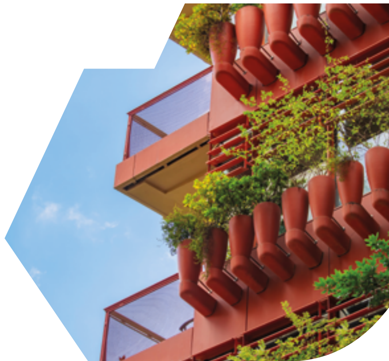
Photo non contractuelle ne constituant pas un engagement quant aux futures acquisitions.